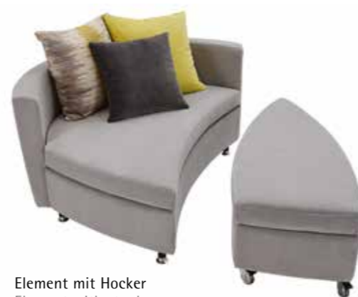
Element mit Hocker Element with stool

The seat cushions of the Serene elements and the stool are attached to the structure with Velcro. The covers of the seat- and back cushions are removable, which makes them easy to clean. On request we also offer Serene with fully removable covers.