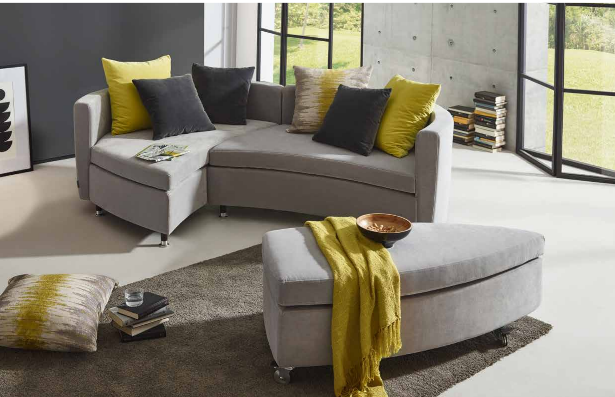
2 Elemente und Hocker: ca. 240 x 155 cm 2 elements side by side plus stool: approx. 240 x 155 cm

Our cosy lounge idyll lends personality to your living room. As an alternative to classic sofa shapes it offers you a variety of possibilities to enjoy life in a creative way. As a smart corner seating solution, as a single sofa for relaxing, or as a cosy corner – Serene makes a refreshing difference! You can even use it as a guest bed for two.