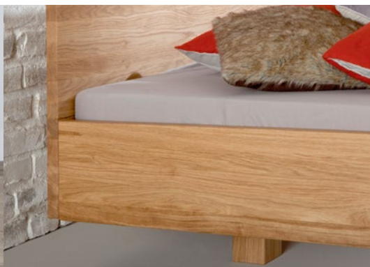
Mit oder ohne Kopfteil erhältlich